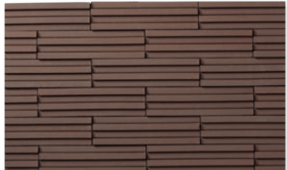
30 (**4.1YR 3.4/1.3)