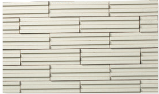
10 (**2.9Y 8.0/1.6)