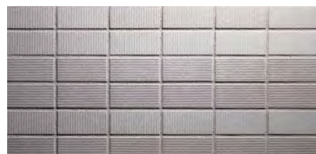
TN452NT/NY-SC43 縦筋面 (NT面) (NT)、横筋面 (NY面) (NY) 2面状パターン 設計価格 ¥2,900/m 2