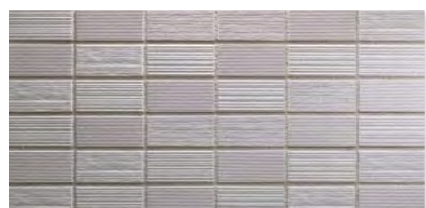
TN452NP/HC/NY-SC43 ストライプ面 (NP)、横筋面 (HC面) (HC)、横筋面 (NY面) (NY) 3面状ミックス 設計価格 ¥2,700/m 2