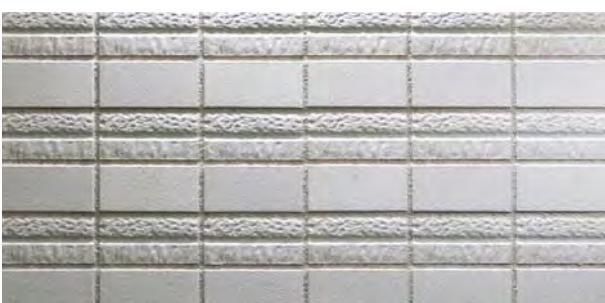
TN452D/F-SC43 二層面 (D)、フラット面 (F) 2面状パターン 設計価格 ¥2,900/m 2