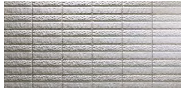
TN452D-SC43 二層面 (D) 1面状 設計価格 ¥2,700/m 2