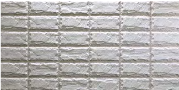
TN452RC-SC43 ロック面 (RC) 1面状 設計価格 ¥2,700/m 2