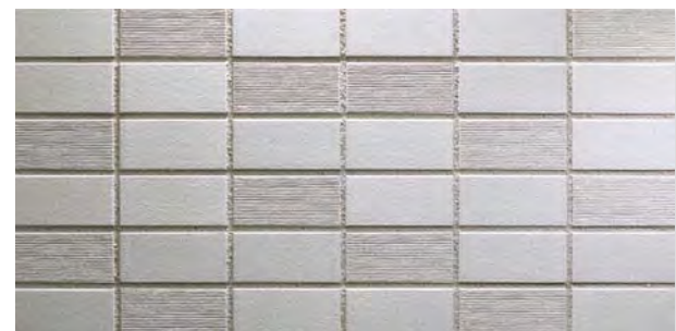
TN452F/HC-SC43 フラット面 (F)、横筋面 (HC面) (HC) 2面状ミックス 設計価格 ¥2,700/m 2