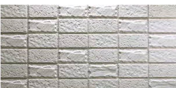
TN452R/SH/RC-SC43 石面 (R)、ショット面 (SH)、ロック面 (RC) 3面状ミックス 設計価格 ¥2,700/m 2