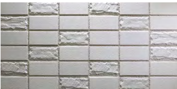
TN452F/RC-SC43 フラット面 (F)、ロック面 (RC) 2面状ミックス 設計価格 ¥2,700/m 2