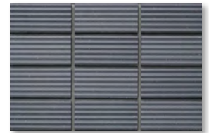
ZIC14 濃色/N3.6 淡色/N3.8