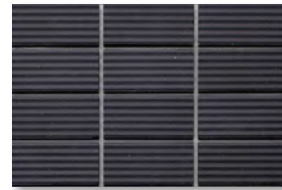
ZIC13 濃色/N2.7 淡色/N2.8