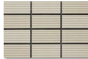
ZIC15 濃色/3.2Y 6.7/1.3 淡色/4.3Y 7.0/1.2