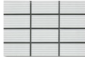
ZIC11 濃色/N7.7 淡色/N7.9