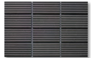
ZIC20 濃色/9.5YR 3.3/0.8 淡色/9.6YR 3.6/0.5