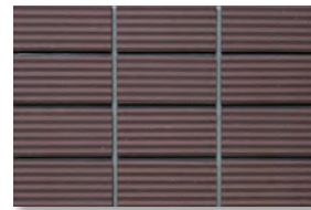
ZIC19 濃色/3.4YR 3.4/1.5 淡色/3.1YR 3.5/1.4