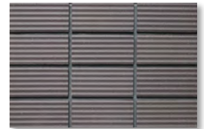
ZIC18 濃色/4.8YR 3.9/0.8 淡色/4.7YR 4.0/0.8