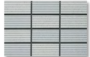
ZIC12 濃色/N6.4 淡色/N7.3