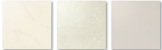
SP-3200(300mm角) ○HQT-3206(300mm角) W3B303(300mm角) QT-4020(400mm角) ○HQT-4206(400mm角) W4B403(400mm角) SP-6200(600mm角) HQT-6206(600mm角) ■トメ枠対応可 ■トメ・タレ枠対応可 ■トメ・タレ枠対応可