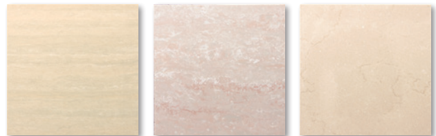
○M-32218(300mm角) W3B302(300mm角) ○TPG-3002(300mm角) ○M-42218(400mm角) W4B402(400mm角) ○TPG-4001(400mm角) ■トメ枠対応可 ■トメ枠対応可