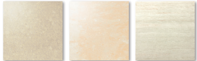
W3B301(300mm角) NS-4202(400mm角) ○M-32213(300mm角) W4B401(400mm角) ○M-42213(400mm角) ■トメ枠対応可 ■トメ枠対応可